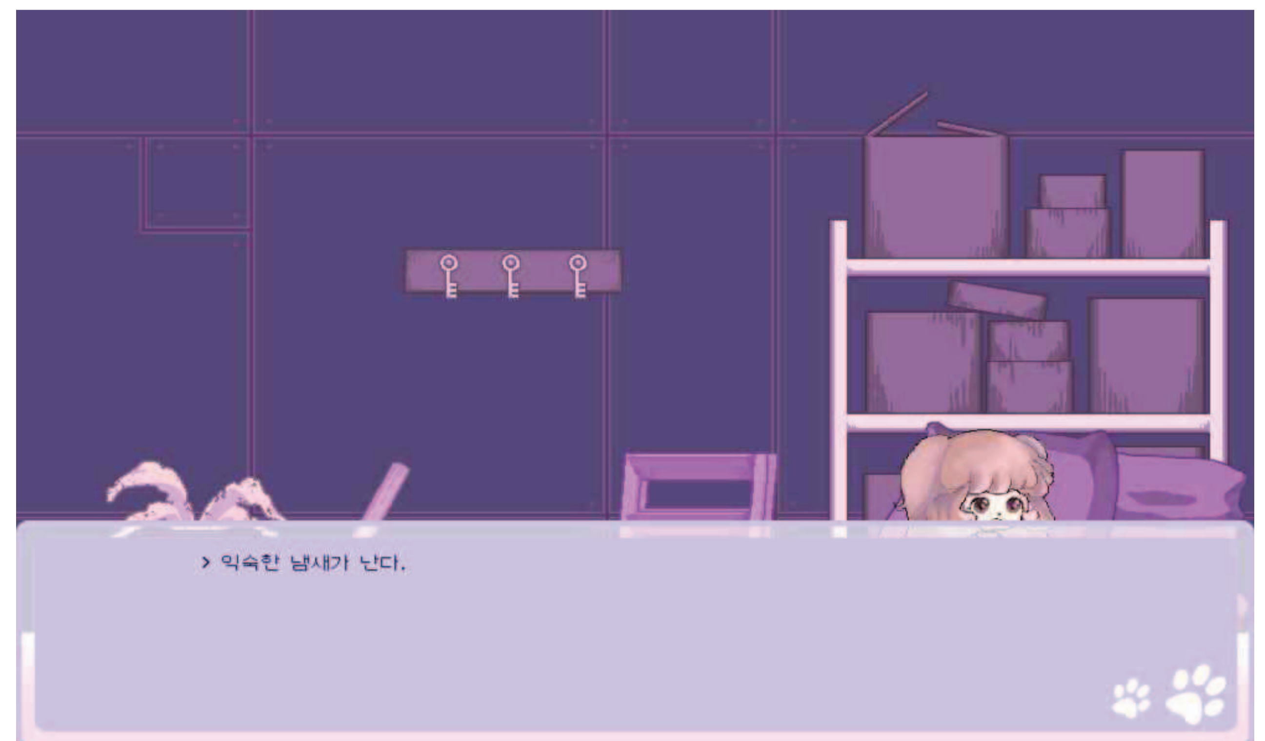
반려 동물의 열악한 환경